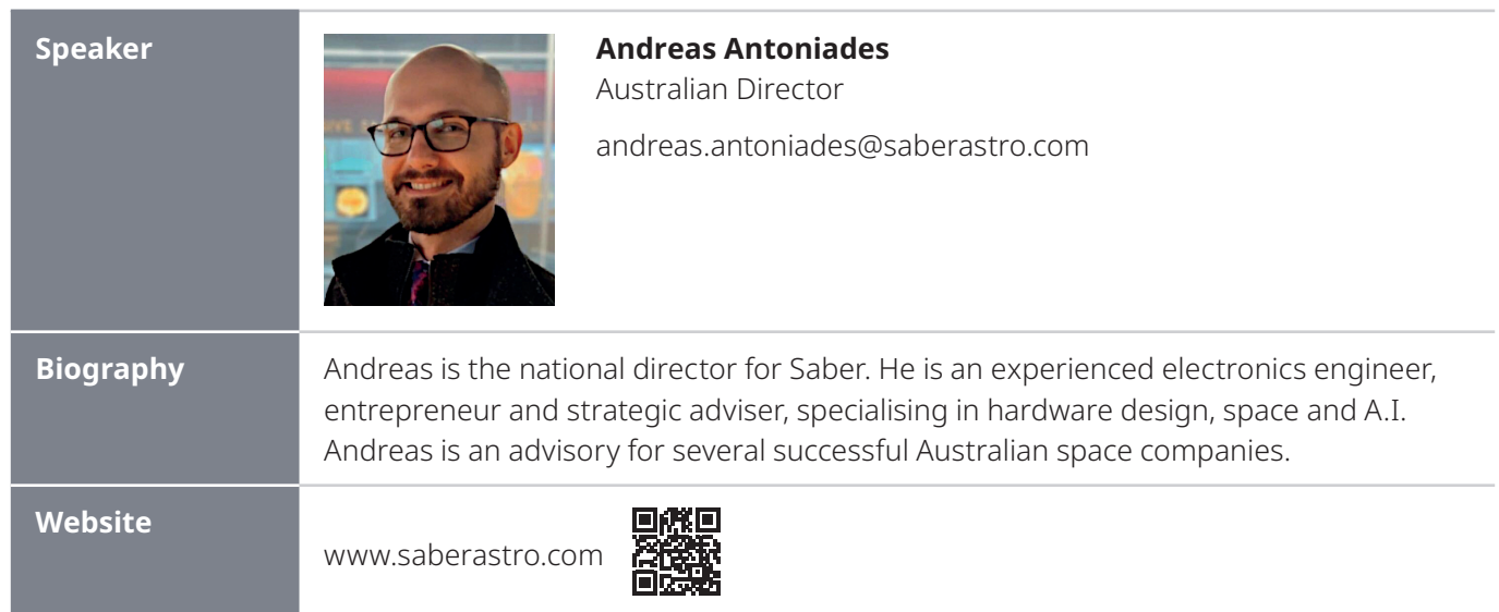
Exhibit Title Saber Astronautics. A Global Space Asset Management Provider.

Exhibit Details Saber is an international space asset management company that specialises in space operations as a service, mission design, and the establishment of global space traffic management systems.